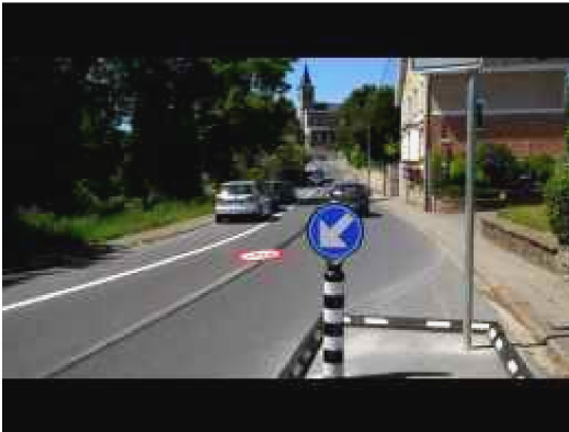
Plusieurs années après son...