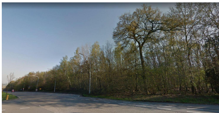
La centrale doit s'installer le bord de la N4 à Sart-Bernard.