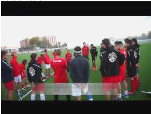
Aische - Couvin 3