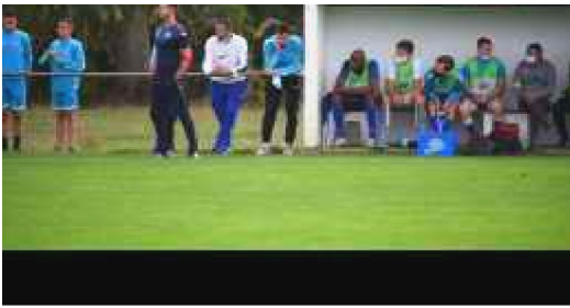
Aische - Couvin 1