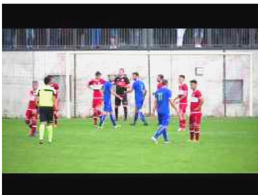
Aische - Couvin 2