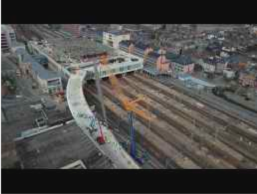
Installation du mât de la gare...