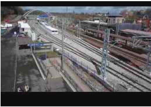
Le nouveau parking de...